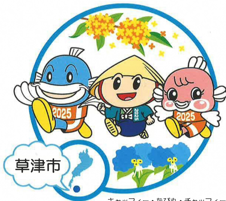
キャッフィー・たび丸・チャッフィー