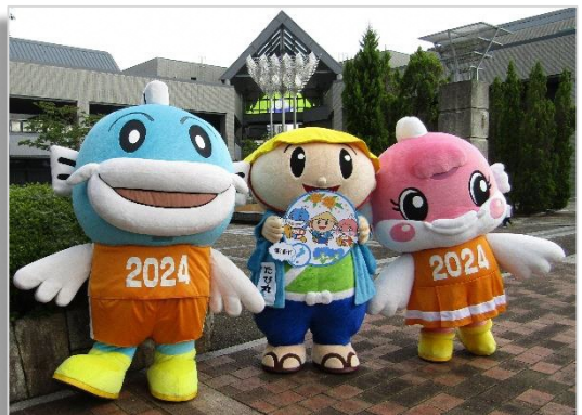
← 草津市役所前で記念撮影☆

本市の、市の木・市の花は、いずれも花と緑豊かなまちづくりの象徴として、市民に選ばれ、前回の「 びわこ国体 」と同年の1981年(昭和56年)に制定されました。