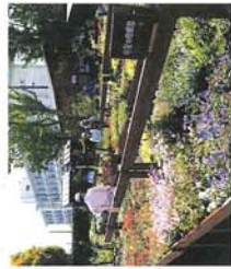
宿根草 小型種、中型種、大型種に分けて陳列していますので、植え場所に合わせて選んでいただけます。