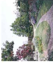
ボーダーガーデン 風雅舎の注目している季節の植物が一目でわかります。長く見ごたえのある2本のロングボーダーが主役です。