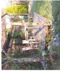
ニューガーデン 菜の花ガーデン、サクラランボ、イチゴ、ズメ、モ、ブラックベリー、季節の野菜など、収穫が楽しめるガーデンです。