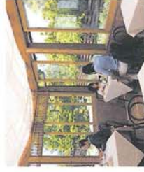
Green House Cafe 移りゆく自然の景色が楽しめるのが魅力のカフェです。サンルームと木陰が心地よいオープンテラスをお楽しみいただけます。