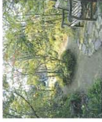
ウッドランド 山の中を再現したような樹木のスペースです。季節の山野草がひっそりと演出していますので小遣の散策が楽しくなります。