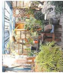
Green House (ショップ) 冬場は室内で育てるものや、雨に当たると涼みやすい、直射日光を嫌うものほか、観葉植物、なども販売しています。