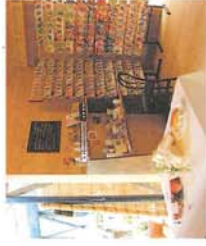
The Barn 軒下をイメージした木の香りのする素晴らしい建物「The Barn」では、ガーデニングと日々の暮らしに彩りを添えるものも提供します。