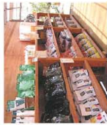
園芸資材 使って安心な産物や使い勝手のいいホースなどを揃えました。風雅舎の周囲でも実際に使っているの良さはオアシスです。

敷地内に7種類のディスプレイガーデンを設けるだけでなく、1000種以上の植物を利用の仕方でも販売しております。2004年5月オープンしたGreen House Cafeは、移りゆく自然の景色が楽しめるのが魅力のカフェです。ガーデナーズランチャやスイーツ&ドリンクをお出ししています。またThe Barnは、ガーデニングと日々の暮らしに彩りを添えるものを提供しています。