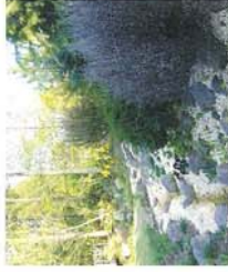
ロックガーデン 珍しい中低木と個性的なコンテナ類を主に、小型のロックプランツが植栽されています。