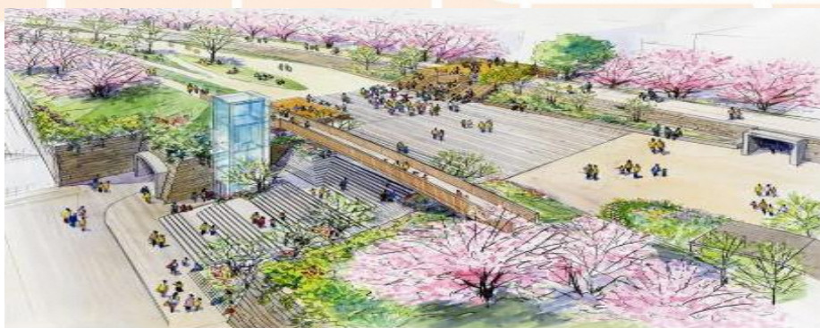
公園広場付近のイメージパーツです

グラッシーの会員の皆様が、いつもお手入れされています草津川跡地公園de愛ひろばを東京オリンピックの聖火リレーが通ります。ワクワクしますね。