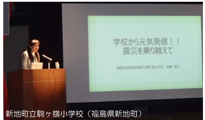
新地町立駒ヶ嶺小学校（福島県新地町）

校舎内のプランターや花壇を増やし、学校内の緑の少年団を中心に花への水やりなどを行っています。授業の一環として行うのではなく、休み時間や放課後に児童たちが自主的に行動するよう教育することで、児童たちが自然に花や植物と接する環境づくりを行っています。校舎の花壇等を通じて、地域とのつながりづくりにも役立っています。