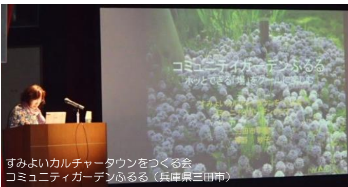
すみよいカルチャータウンをつくる会 コミュニティガーデンふるる（兵庫県三田市）

地域住民が集まり交流する場を作るために「ふるる」を立ち上げました。会員数4名で毎週木曜日に活動しています。コミュニティガーデンの正面に大学があることから、昼食時には多くの学生が集まりにぎわっています。大学のサークルが年に数回イベントを開催するなど、若い世代との交流も盛んであり、「ふるる」自身も季節のイベントを多く開催しています。