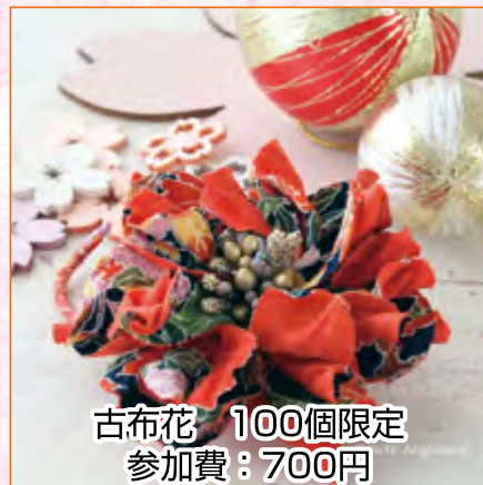
古布花 100個限定 参加費：700円