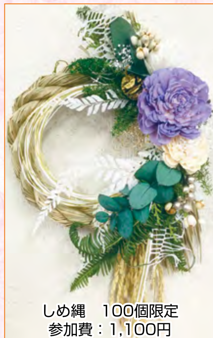
しめ縄 100個限定 参加費：1,100円