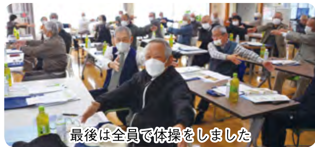
最後は全員で体操をしました

①アルツハイマー型認知症 ②脳血管性認知症 ③レビー小体型認知症 ④前頭側頭型認知症 の4つのタイプに分けられ、記憶が曖昧になったり、時間や場所、人物を認識できなくなったり、言語機能の障害などさまざまな症状が出てきます。また、気分が落ち込んだり、物事への意欲が低下することなどで、さらに症状を悪化させる場合が多いと言われています。