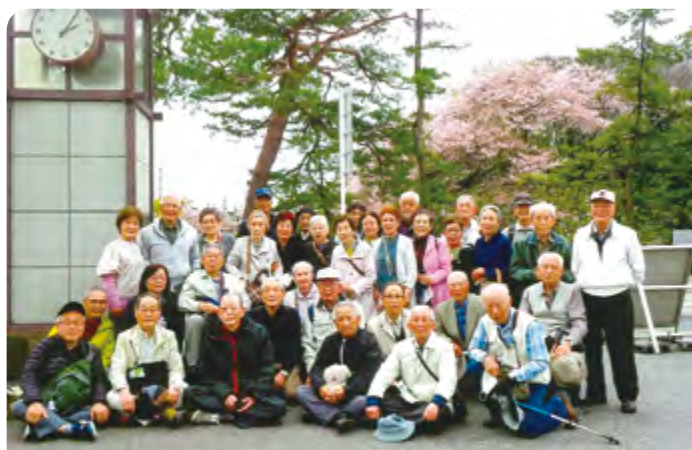
渋川老ク連 2023年春の研修旅行(彦根城) 2023/4/7<金>

てくれました。 事務局のご尽力で、とても楽しい1日を過ごすことができました。参加された皆さん、おつかれさまでした。 (渋川学区 徳井 泉二)