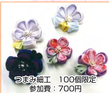
つまみ細工 100個限定 参加費：700円