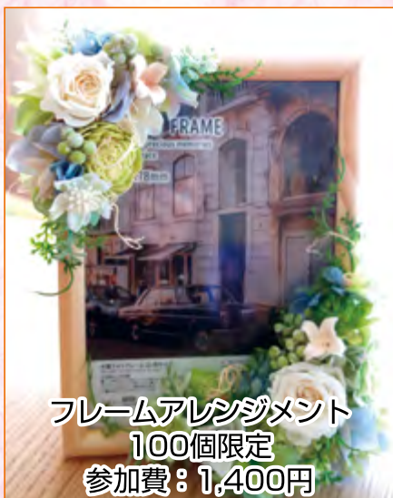
フレームアレンジメント 100個限定 参加費：1,400円