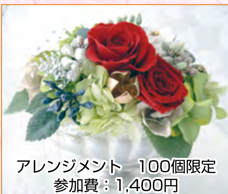
アレンジメント 100個限定 参加費：1,400円