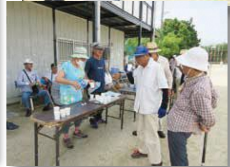
アクエリアス、OS1「飲んで下さい」 熱中症予防に大忙し!