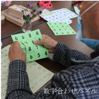
数字合わせパズル