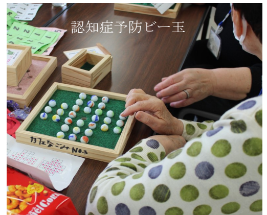
認知症予防ビー玉