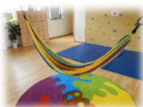
ののみちこども園 本園