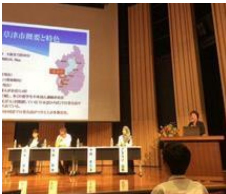
2018年7月23日 公益財団法人東京市町村自治調査会 「地域戦略としての多文化共生」 シンポジウム パネリスト