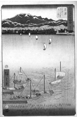
▶ 歌川広重画 五十三次名所図会