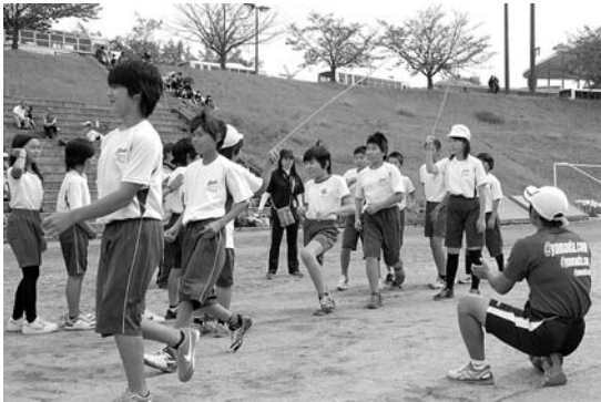
問 スポーツ保健課

レー」が行われました。また、立命館大学の陸上競技部をはじめとする大学の各種競技団体や、JFLに所属するサッカーチーム「MIOびわこ滋賀」などの協力で、各種スポーツの体験コーナーや、パフォーマンスの披露をしてもらいました。子どもたちは、ずっと学級で取り組んできた「長縄8の字跳び」で歓声をあげ、「4×100mリレー」で友だちを大きな声で応援するなど、会場には子どもたちの熱気が溢れていました。また、普段あまり体験することのないスポーツに触れ、トップアスリートの技を直接観ることで、子どもたちにとってスポーツの素晴らしさを実感する一日となりました。これを機に、子どもたちがさらに運動を好きになつてくれることを目指して、これからも取り組みを進めていきます。