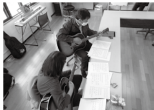
興味関心があることに取り組む