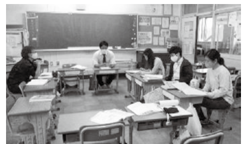
授業づくりについて話し合う先生方