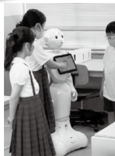
Pepperを活用したプログラミング学習

教職経験豊富なスキルアップアドバイザーを配置し、小中学校教員の授業づくり、学級づくりへの指導支援を行っています。 またICT機器を活用したプログラミング学習の授業支援も行っています。