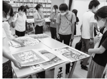
自己啓発講座 (図画工作科) の様子

▼研究発表大会：教育実践研究を推進しています。優れた研究について表彰し、発表しています。 また、今日的な教育課題についての講演会も行っています。