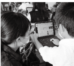
タブレット端末を活用した授業

▼教育課程に関する調査・実践研究：令和元年度は、「子どもの読みの力の向上」に関する研究、令和二年度は「二人一台の学習者端末を活用した授業改善」をテーマに研究を進めています。