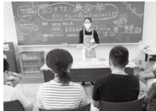
講師を招いて本物の作品作りを体験

問 教育研究所内 やまびこ教育相談室 TEL(077)563-1270(直通) / FAX(077)563-0117