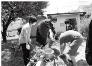
地域の方と育てたジャガイモを収穫