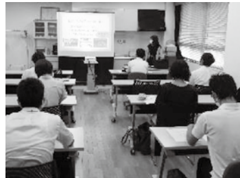
研究発表に聞き入る先生方

▼研究発表大会：教育実践研究を推進しています。優れた研究について表彰し、発表しています。 また、今日的な教育課題についての講演会も行っています。