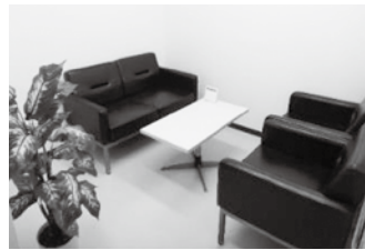
個別の面談をする相談ルーム

▼不登校や行き渋りをはじめ、子育ての悩みを抱える保護者の相談や悩みを抱える本人の相談(じっくり話を聞いたり、遊んだりして)を行っています。