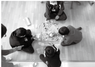
ゲームを通してコミュニケーション力を育む