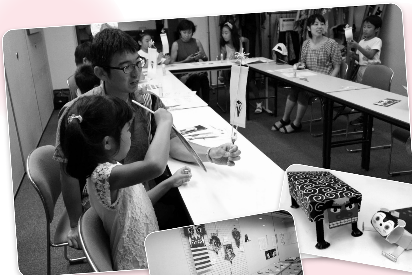
▲ワークショップでのぼりざるを作って遊ぶ様子

さらに、昨年度から実施している子ども向けのワークショップをテーマ展と関連させ、江戸時代の玩具を作るワークショップも開催し、多くの子どもたちに参加していただくことができました。