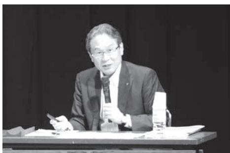
▲文化振興フォーラムの様子