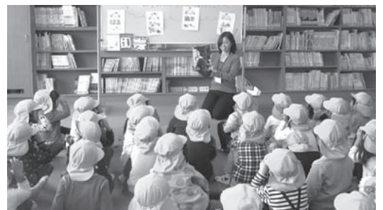
▲ 地域の幼稚園児を招待しての本の読み聞かせ