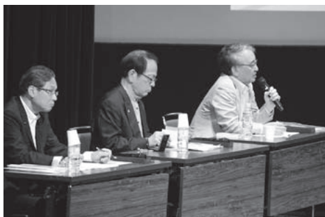
▲トークセッションの様子