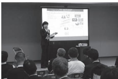
▲学校教育フォーラムには非常にたくさんのかたが来られました