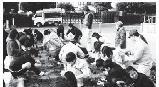
▲ 地元の高校生との協働による「なでしこ」の植え付け