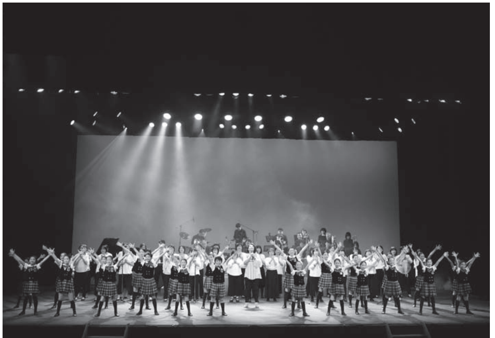
▲文化振興フォーラムのフィナーレを飾った草津歌劇団と市内文化団体の皆さま