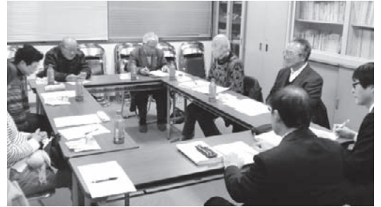
▲ 学校運営協議会の様子

変化の激しいこれからの社会では、学校や子どもが抱える課題も多岐にわたり、学校だけの考え方では対応が難しいケースが予想されます。コミュニティ・スクールは、各校に学校運営協議会を設け、保護者、地域住民等が委員となって学校運営やそのために必要な支援について協議を行い、特色ある学校づくりを地域と学校が連携・協力・協働して、実現させるものです。