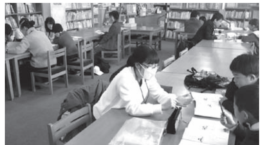
▲ ボランティアによる休業中のオープンスクール