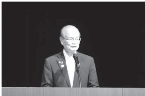
▲市長による開式挨拶

草津市文化振興フォーラムでは基調講演や事例報告、トークセッション等が開催された他、 草津歌劇団や市内の文化団体がオープニングとフィナーレに出演し、草津文化の新たな幕開けを盛大にお祝いしました! また、学校教育フォーラムでは、草津の学校教育についてのプレゼンテーション、学校教育の今後の指針説明が行われ、 学校の教員を含めた草津一丸での取り組みを目指すための場となりました。