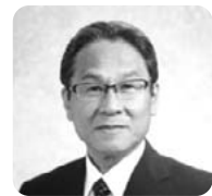
教育委員会教育長 川那邊 正