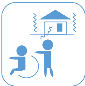
災害時の助け合い (要援護者への支援等)

子どもを狙った凶悪な犯罪 や、東日本大震災や能登半島地震のよ うな 災害時は、個人の力だけでは対応できません。