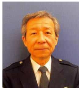
草津栗東防犯自治会顧問 (草津警察署長) 大橋 忍

今後も皆様とともに、地域安全活動の推進に努めてまいりますので、本年もより一層の御理解、御協力を賜りますようお願い申し上げます。