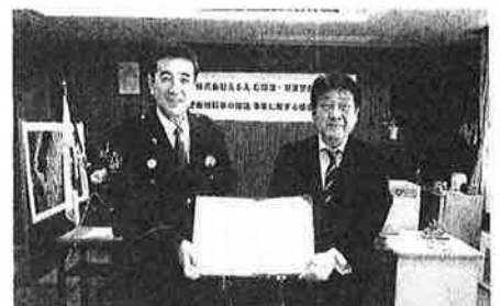
▲えふえむ草津と締結式を行いました

3月3日草津警察署にて、えふえむ草津と草津警察署が協定書を締結しました。今後月2回、番組内で草津警察署から住民へ、犯罪や事故から守る防犯情報等が放送される予定です。