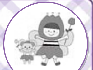
チューリップ事業 イメージキャラクター チュウちゃん&リップちゃん

不安を抱える女性が社会の絆・つながりを回復することができるよう、「草津市社協チューリップ事業」では生理用品の提供を通じて、必要な相談や支援につなげます。生理の貧困解消のためこの取組にご理解いただき、皆様からの寄付のご協力をお願いします。