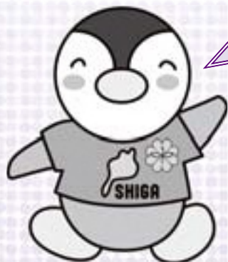
滋賀県民生委員・児童委員 キャラクター「びわっ湖 ミンジー」

草津市では、令和4年4月現在249人の民生委員・児童委員が委嘱を受けて活動しています。(任期3年)