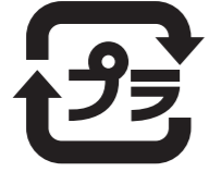
このマークが目印です

商品の中身を使い切ったり、取り出した時に不要になるプラスチック製の容器や包装です。リサイクルのために、 汚れを取って出す ことがポイントです。