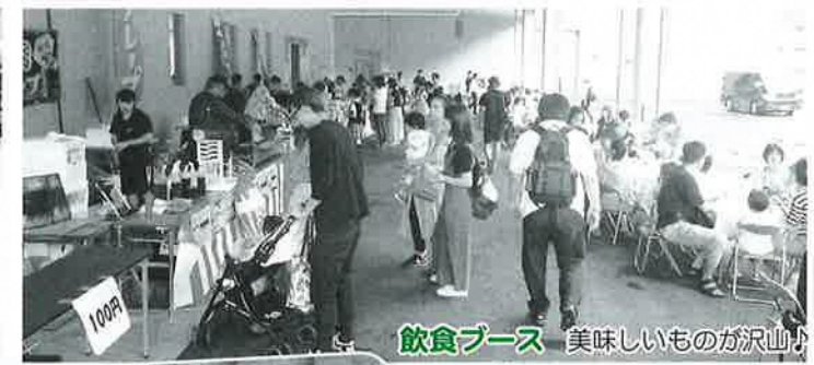
飲食ブース 美味しいものが沢山