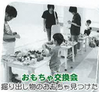
おもちゃ交換会 掘り出し物のおもちゃ見つけた