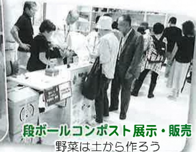
段ボールコンポスト展示・販売 野菜は土から作ろう