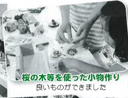
桜の木等を使った小物作り 良いものができました