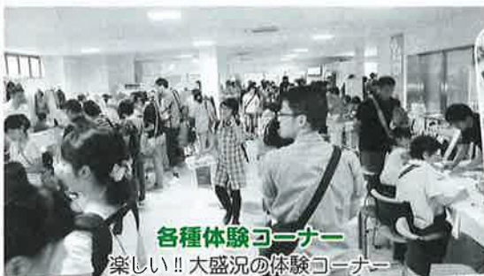
各種体験コーナー 楽しい!! 大盛況の体験コーナー