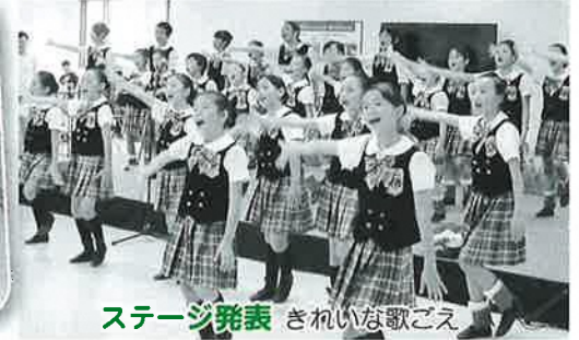
ステージ発表 きれいな歌ごえ