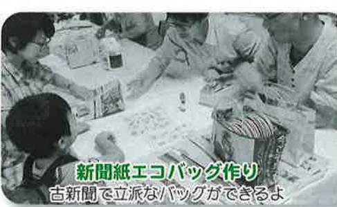
新聞紙エコバッグ作り 古新聞で立派なバッグができるよ