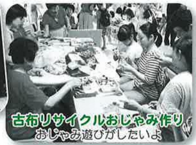
古布リサイクルおじやみ作り おじやみ遊びがしたいよ