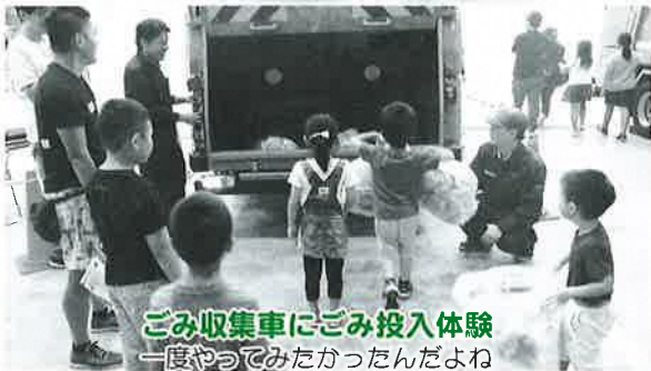
ごみ収集車にごみ投入体験 一度やってみてみたかったんだよね