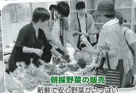
朝採野菜の販売 新鮮で安心野菜がいっぱい