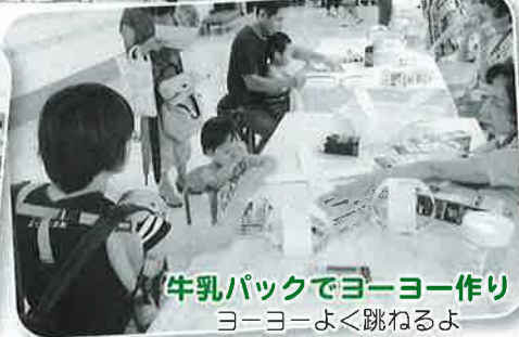
牛乳パックでヨーヨー作り ヨーヨーよく跳ねるよ