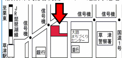
(仮称)市民総合交流センター建設予定地