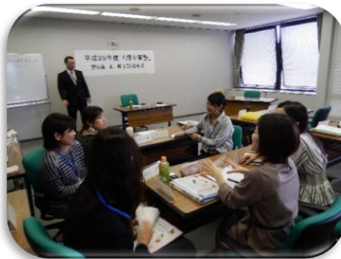
輝☆業塾でのグループワークの様子

自分の特技や資格を活かして起業にチャレンジしたい。そんな女性のための輝☆業塾を開催します。同じ志を持った女性たちがそれぞれの夢に向かって、お互いに成長し合うことができると、例年大変好評な講座です。