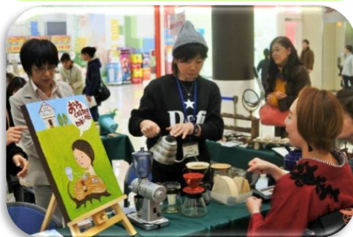
昨年の輝りんマートの様子

輝☆業塾で学んだ知識を活かす実践の場としてイオンモール草津においてチャレンジショップを開催します。ぜひお立ち寄りいただき、塾生の活躍を応援ください。