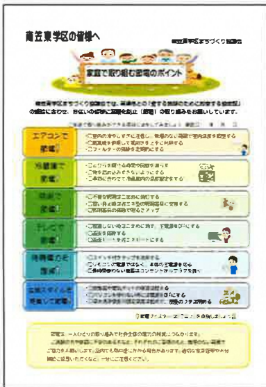
▲家庭で取り組む節電ポイント