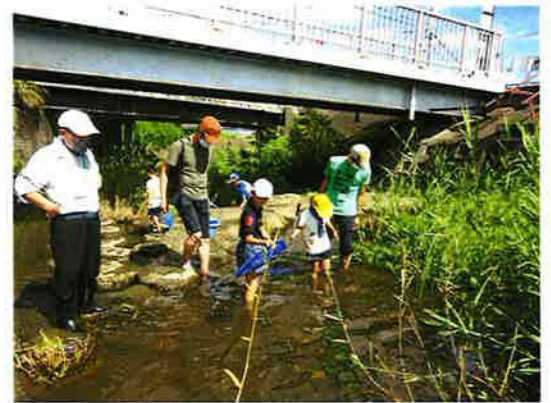
▲環境学習（狼川探検）