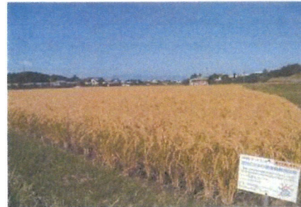
▲生ごみから有機肥料へ