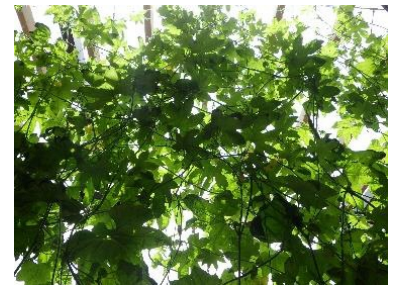
<窓の内側から見た様子>