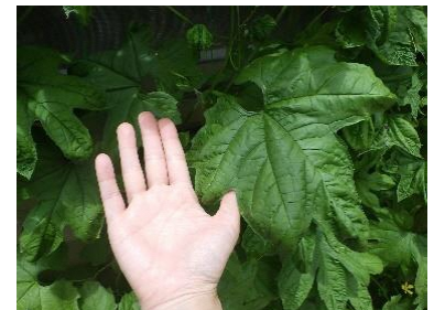
<手のひらより大きく育った葉>