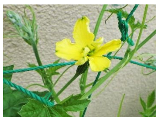
めばな <雌花> 付け根がゴツゴツ