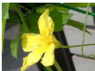
おばな <雄花> 付け根はすっきり