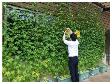
<ゴーヤーの収穫の様子>

皆様のご自宅のゴーヤーカーテンの成長はいかがでしょう？ クリーンセンターで栽培中のゴーヤーカーテンは、緑が涼しげで、 ギラギラとした日差しもばっちり遮っています！ 梅雨明けには、立派に成長したゴーヤーの実の収穫を行いました。 さまざまな形、大きさの実の収穫ができました。収穫したゴーヤー を使ってエコクッキングにもチャレンジしたいですね！