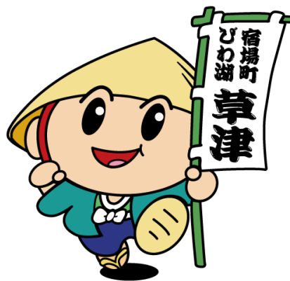
草津市公認マスコットキャラクター「たび丸」