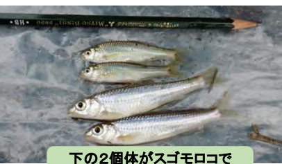
下の2個体がスゴモロコ 絶滅危惧種(前畑政善)