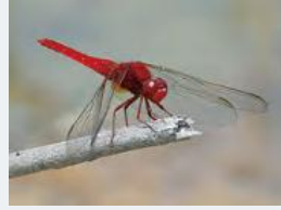
ショウジョウトンボ 成虫