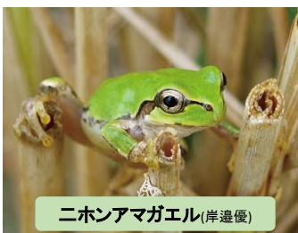
ニホンアマガエル(岸邊優)