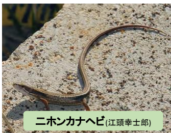
ニホンカナヘビ(江頭幸士郎)