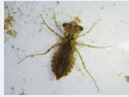
ショウジョウトンボ 幼虫