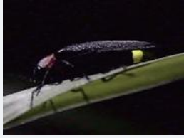
ゲンジボタル 成虫