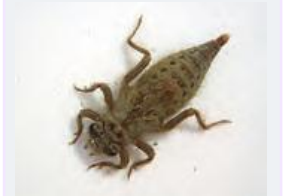
キイロサナエ 幼虫