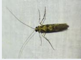
ヒゲナガカワトビケラ 成虫