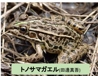
トノサマガエル(田邊真吾)