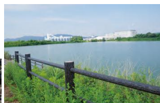
ため池の野池における 景観(長田智生)