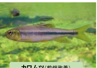
カワムツ(前畑政善)

希少種のモツゴ(長田智生) ため池で確認された魚類は13種と少なかったのですが、河川や水路ではまったく確認されなかったモツゴが5つの池で獲れました。