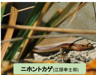
ニホントカゲ(江頭幸士郎)

ナゴヤダルマガエル(田邊真吾) 滋賀県レッドデータブック2010年版の絶滅危機増大種であり、県の指定希少野生動植物種でもあります。全国各地で激減していますが、県内では比較的多く見られます。水の豊かな水田や水路が多いためと考えられています。