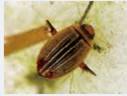
コシマゲンゴロウ