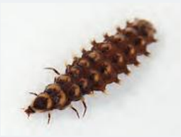
ゲンジボタル 幼虫