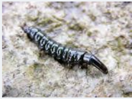
ヒゲナガカワトビケラ 幼虫