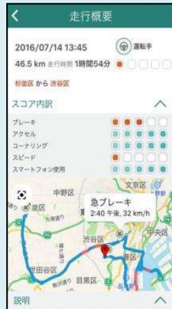
安全運転のヒント