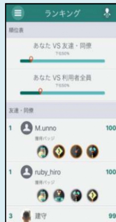
ランキング・バッジ獲得