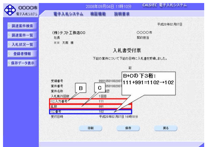
図1. 2. 入札書受付票