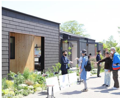
▲de 愛ひろばでのヒアリングの様子