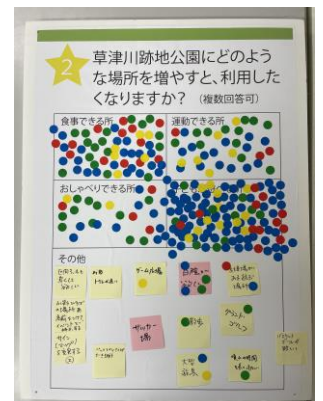
▲ヒアリング時の意見ボード