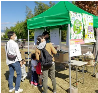
▲ai 彩ひろばでのヒアリングの様子