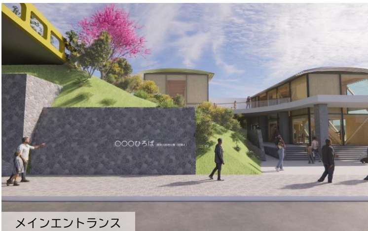
メインエントランス