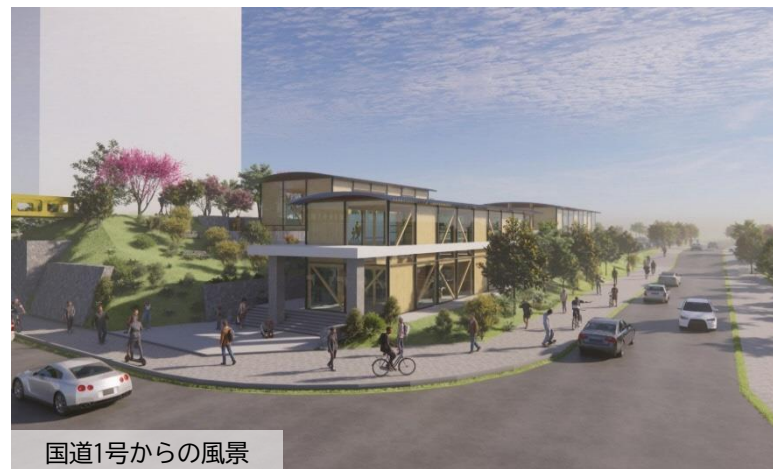
国道1号からの風景