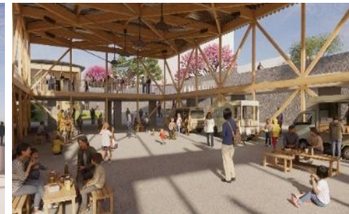
滞留空間、遊び場、イベントスペースとして多機能な利用