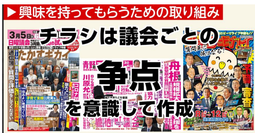
図2 「アートな議会だよりデザイン」

「一般質問前後インタビュー」では質問の概要など説明した後に、一般質問、そして終了後のインタビューがコンパクトにまとめられており、分かりやすかった。