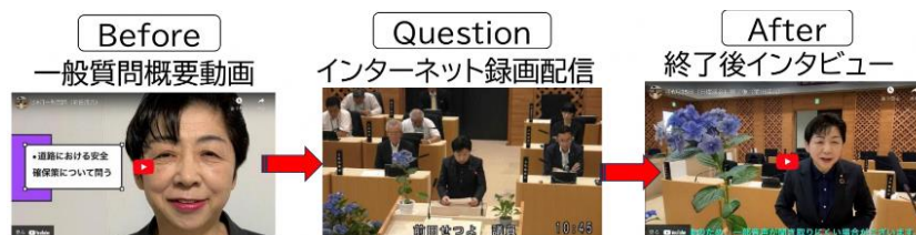
図1 「一般質問前後インタビュー」

「議会だより」だけでなく、SNS・Webサイト・動画など様々なツールを用いて市民にアプローチする市議会が多かった。特に目を引いたのは開成町の「一般質問前後インタビュー（図1）」と鷹栖町の「アートな議会だよりデザイン（図2）」だった。