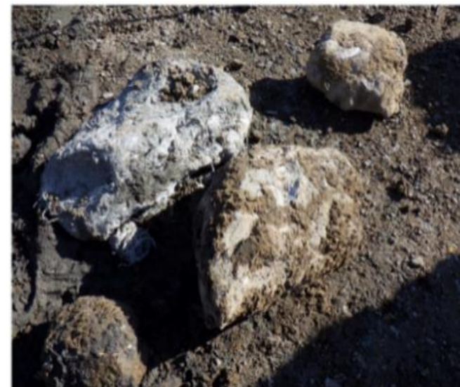
確認された地中障害物