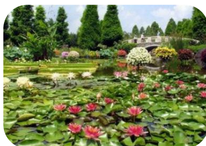
水生植物公園みずの森