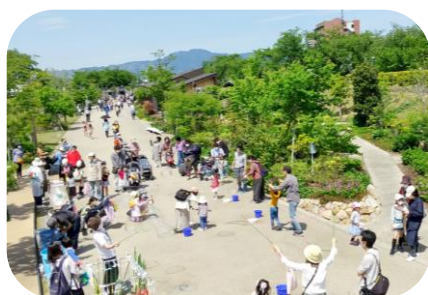
草津川跡地公園（区間5 de愛広場）