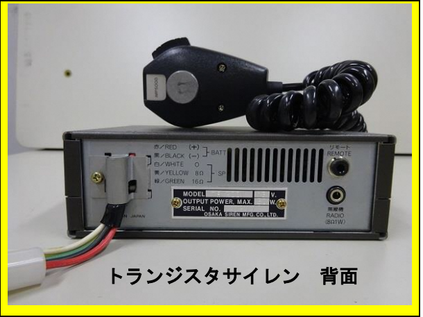
トランジスタサイレン 背面