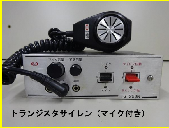
トランジスタサイレン (マイク付き)