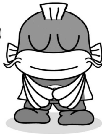
滋賀県の イメージキャラクター キャッフィー

ご協力ありがとうございました。 三つ折りにして、同封の返信用封筒に入れて、 10月4日（金）まで にご返送ください。