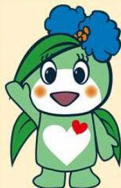
草津市社協キャラクター ふくちゃん

有料駐車場・駐輪場が隣接していますが、混雑が予想されますので、できる限り乗り合わせか、公共交通機関をご利用ください。