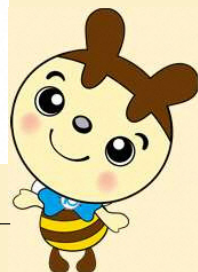
事業団マスコットキャラクター まち活マッチ