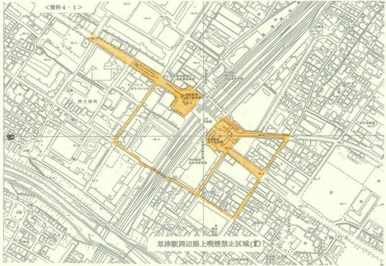
草津駅周辺路上喫煙禁止区域(案)