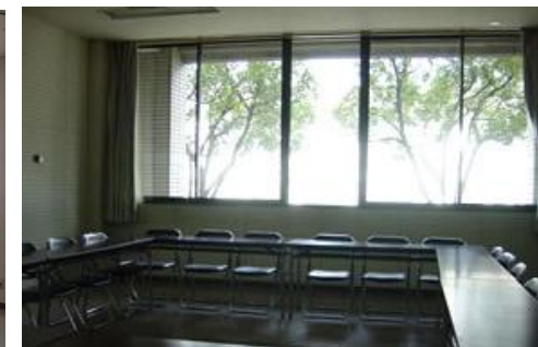
練習室 2 (約 42 m 2 )