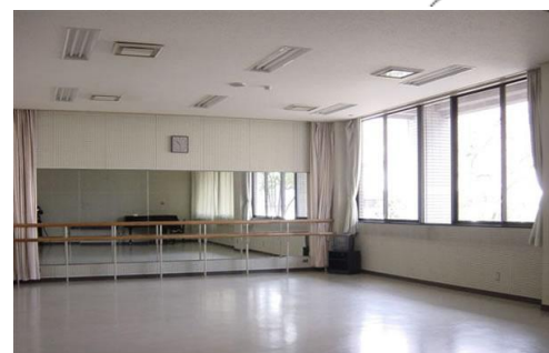
練習室 1 (約 90 m 2 )