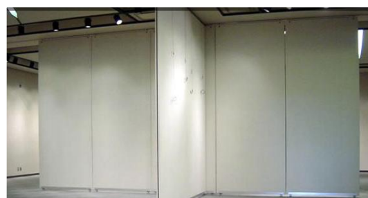
展示ホール (約 287 m 2 )