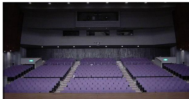
ホール (801 席)