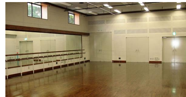
リハーサル室 (約 142 m 2 )