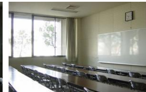
練習室 3 (約 42 m 2 )