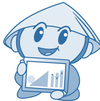
草津市公認マスコット「たび丸」

計画の進捗状況を点検・評価し、その結果を改善につなげるため、各事業の実施状況について、毎年市民や関係者を構成員にもつ草津市教育情報化推進懇談会に報告し、多様な意見をいただきながら、点検・評価を行い、その結果を施策の展開に反映させ、効果的かつ継続的な推進を図ります。