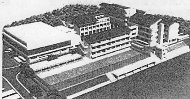
高穂中学校増築イメージ図

校舎の増築を行い、生徒数、児童数の増加に対応した適正な施設規模を確保することで、教育環境の向上を図ります。