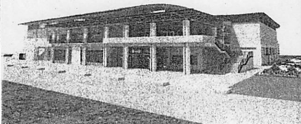
野村公園体育館イメージ図