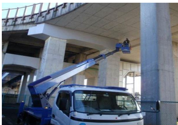
橋梁の定期点検 橋梁の打音・目視検査の様子