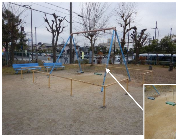
公園の老朽化した遊具 支柱に劣化がみられる。