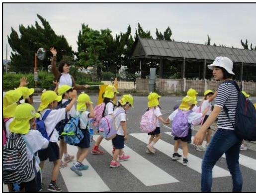
市道宮町若竹線における園児横断