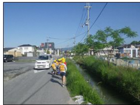
市道矢橋南笠野路線の通学路の様子