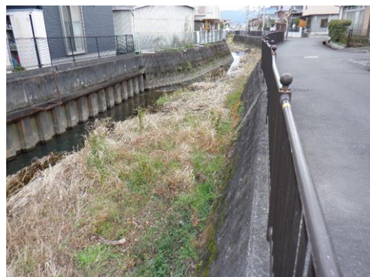
伊佐々川 西渋川一丁目地先（土砂堆積）