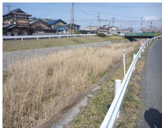
狼川 南笠町地先（雑草繁茂・土砂堆積）