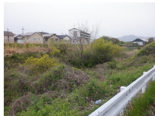
草津川廃川敷 上笠四丁目地先（雑木・雑草繁茂）