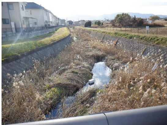
十禅寺川 南笠町地先（雑草繁茂・土砂堆積）