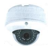
防犯カメラ設置物