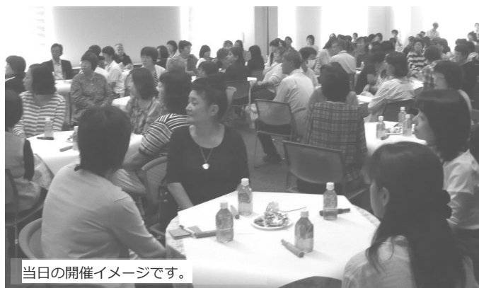
当日の開催イメージです。