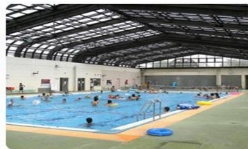
25mプール 長さ25m 幅13m 水深110～130cm