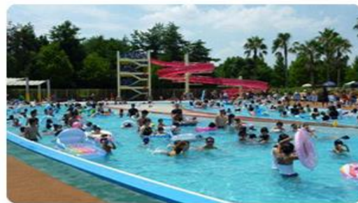
流水プール 一周200m・幅8m・水深100cm