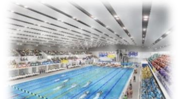
(仮称)草津市立プール 完成イメージ

令和6年に竣工予定の市民の健康およびスポーツ競技を目的とした屋内プール(草津市西大路町)。 50mプール、25mプール、飛び込み競技用プールを併設しており、令和7年に開催予定の滋賀国体(国民スポーツ大会)の水泳競技会場としても使用される。