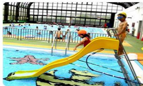
幼児プール 長さ13m・幅6m・水深40～50cm