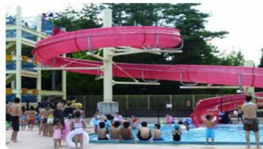
スライダープール 高さ8m・全長66m・着水面65㎡・水深85cm

ロクハ公園プールは、令和5年度は8月31日（木）まで営業しております。 是非ご利用ください。