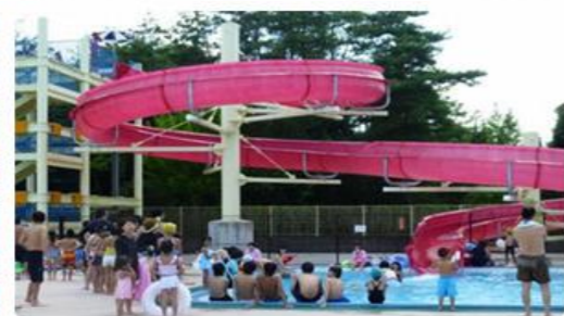
スライダープール 高さ8m・全長66m・着水面65㎡・水深85cm

ロクハ公園プールは、令和5年度は7月1日から8月31日まで営業しておりますので、またご利用ください。