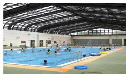
25mプール 長さ25m 幅13m 水深110~130cm