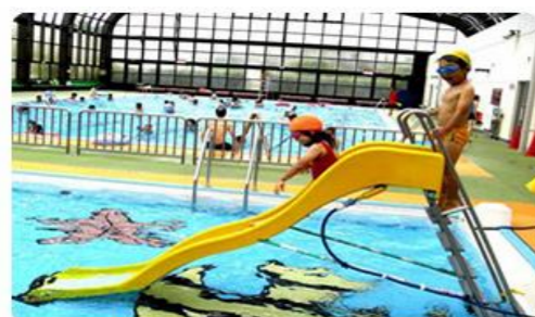
幼児プール 長さ13m・幅6m・水深40~50cm