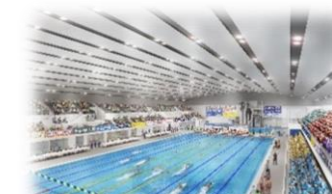
(仮称)草津市立プール 完成イメージ

令和6年に竣工予定の市民の健康およびスポーツ競技を目的とした屋内プール(草津市西大路町)。50mプール、25mプール、飛び込み競技用プールを併設しており、令和7年に開催予定の滋賀国体(国民スポーツ大会)の水泳競技会場としても使用される。