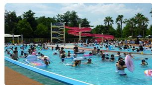
流水プール 一周200m・幅8m・水深100cm