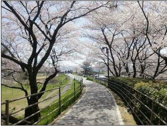
草津川跡地の桜並木

JR 草津駅周辺には、シティホテル、百貨店、店舗付高層マンションや大型複合店（ショッピングモール）などの大型商業施設の集積が見られ、都市景観を形成している。