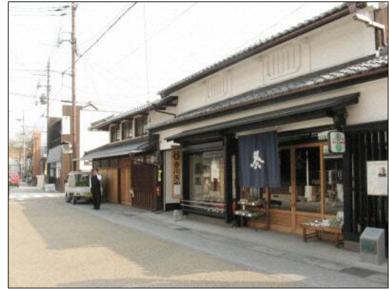
本陣エリアのまちなみ