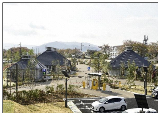
整備された草津川跡地