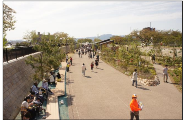
草津川跡地公園 de 愛ひろば