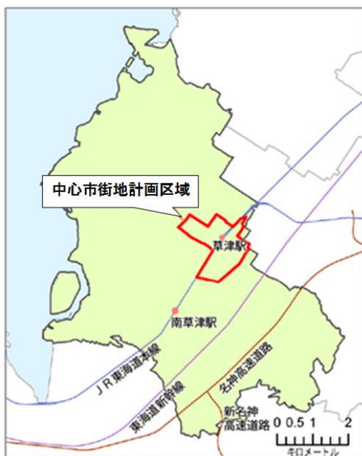
草津市の中心市街地の位置

前期計画では、niwa+（ニワタス）や草津川跡地公園の整備、本陣エリアでのテナントミックス事業等を展開し、各事業実施地点での集客等、一定の成果を上げてきたが、エリア間での相乗効果や全体への波及効果が得られるまでには未だ至っていない。