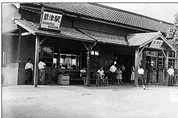
1954(昭和29)年当時の草津駅

市中央部を東西に流れ琵琶湖に注いでいた旧草津川は、まちなかを流れる天井川として全国的にも有名であったが、2002（平成14）年に新草津川が完成し、全川で通水が開始されたことにより川としての役割を終え、現在では公園として整備され、まちの新しいスポットとして生まれ変わっている。