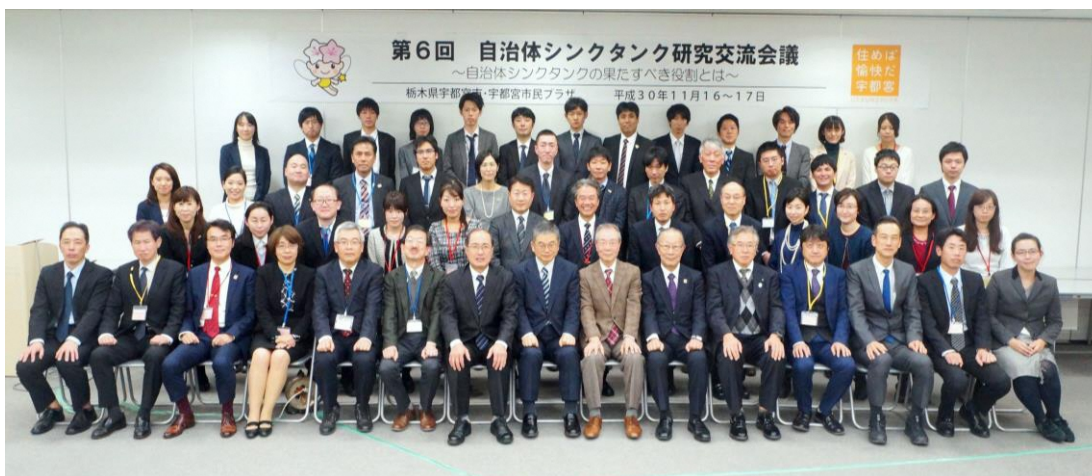
第 6 回自治体シンクタンク研究交流会議

栃木県宇都宮市で開催された第 6 回自治体シンクタンク研究交流会議 (2018(平成 30)年 11 月 16 日・17 日) では、「自治体における政策研究の意義」をテーマとした講演や、「自治体シンクタンクの役割と位置づけ」をテーマとしたパネルディスカッション、「政策研究における調査研究手法」「持続可能なまちづくり」をテーマとしたグループディスカッションが行われた。次回の自治体シンクタンク研究交流会議は、大阪府豊中市で開催予定。