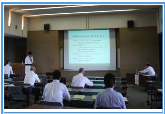
調査研究報告会の様子