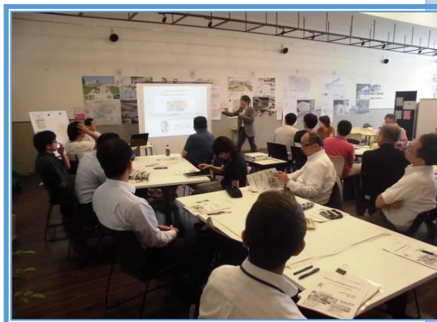
UDCBK で開催しているセミナーの様子