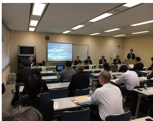
第4回自治体シンクタンク研究交流会議

（2016（平成28）年11月4日・5日）に、当研究所の相談役、顧問等が出席し、地方創生における自治体シンクタンクの役割について、パネルディスカッション等で意見交換が行われた。次回の自治体シンクタンク研究交流会議は、埼玉県春日部市で開催する予定である。