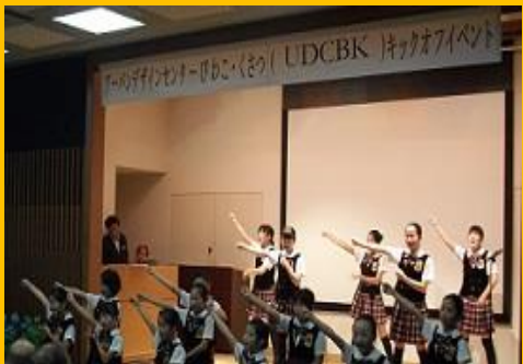
アーバンデザインセンターびわこ・くさつ (UDCBK) キックオフイベント