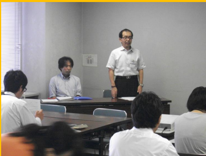
政策形成実践研修 第4回(報告会)