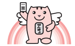
▲明るい選挙のイメージキャラクター「選挙のめいすいくん」

若年層の投票率が低くなると、若者の声が政治に十分反映されなくなることも考えられます。下のグラフを見ると、若年層(特に20、30代)の人の投票率は低いことがわかります。私たちの将来を決める大切な一票です。皆さん、投票に行きましょう！